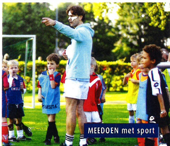
MEEDOEN met sport

Stichting Leergeld verwijst in eerste instantie naar wettelijk voorliggende voorzieningen, indien aanwezig. Daarnaast biedt de stichting ook zelf hulp in de vorm van een voorschot, gift of renteloze lening. Maar ook in natura. Stichting Leergeld behandelt uw aanvraag in alle vertrouwelijkheid.