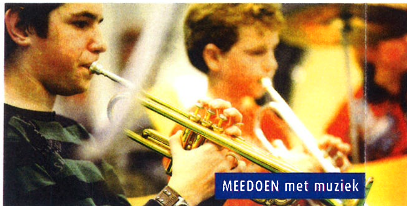
MEEDOEN met muziek