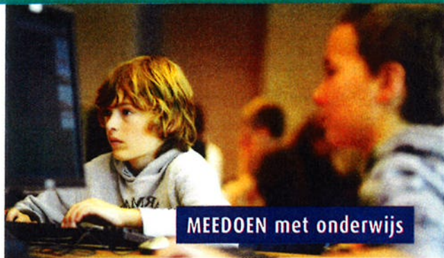
MEEDOEN met onderwijs

In steeds meer gezinnen is het niet haalbaar om de kinderen mee te laten doen met sportclubs of muzieklés. Zelfs de kosten die de school met zich meebrengt (bijvoorbeeld schoolbenodigdheden, kamp en excursies) zijn voor steeds meer mensen niet op te brengen. Soms kunnen deze gezinnen geen of achteraf pas een beroep doen op bijzondere bijstand of een andere voorziening. Zij kunnen echter wel rekenen op steun van Stichting Leergeld.